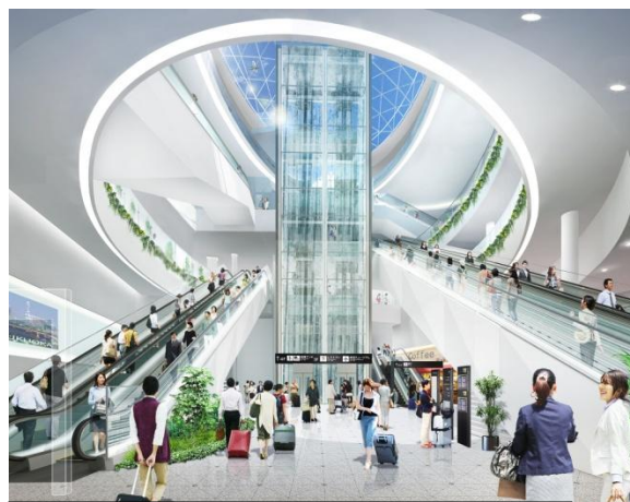
地下鉄アクセスホール (2019年春)