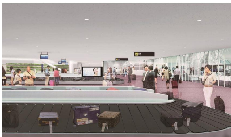
ターミナル南側1階手荷物受取所 (2018年8月29日)